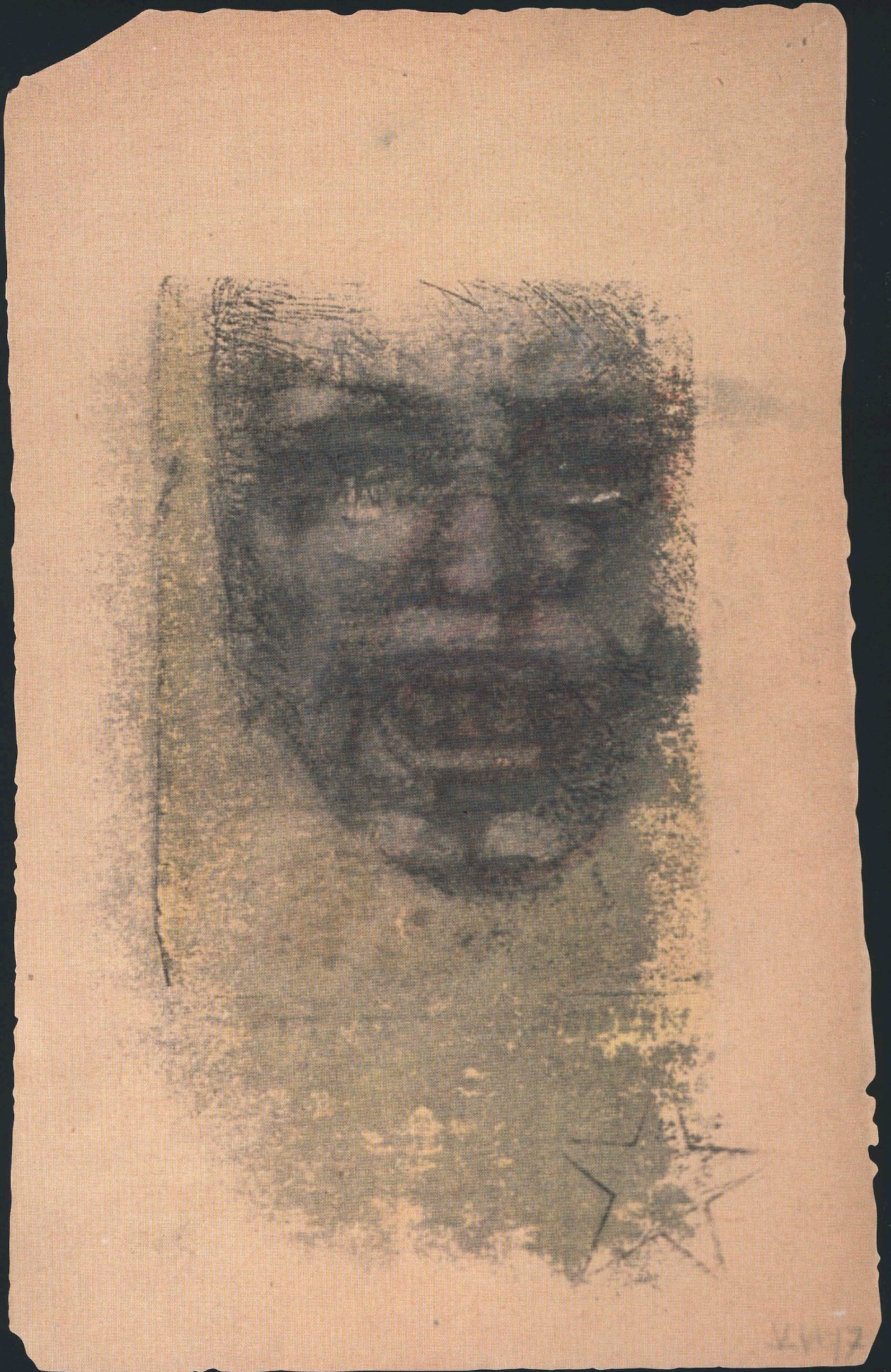
Gay Bashing , 1997

Transfert sur papier rehaussé de crayons et de fards, 11,5 x 18 cm.