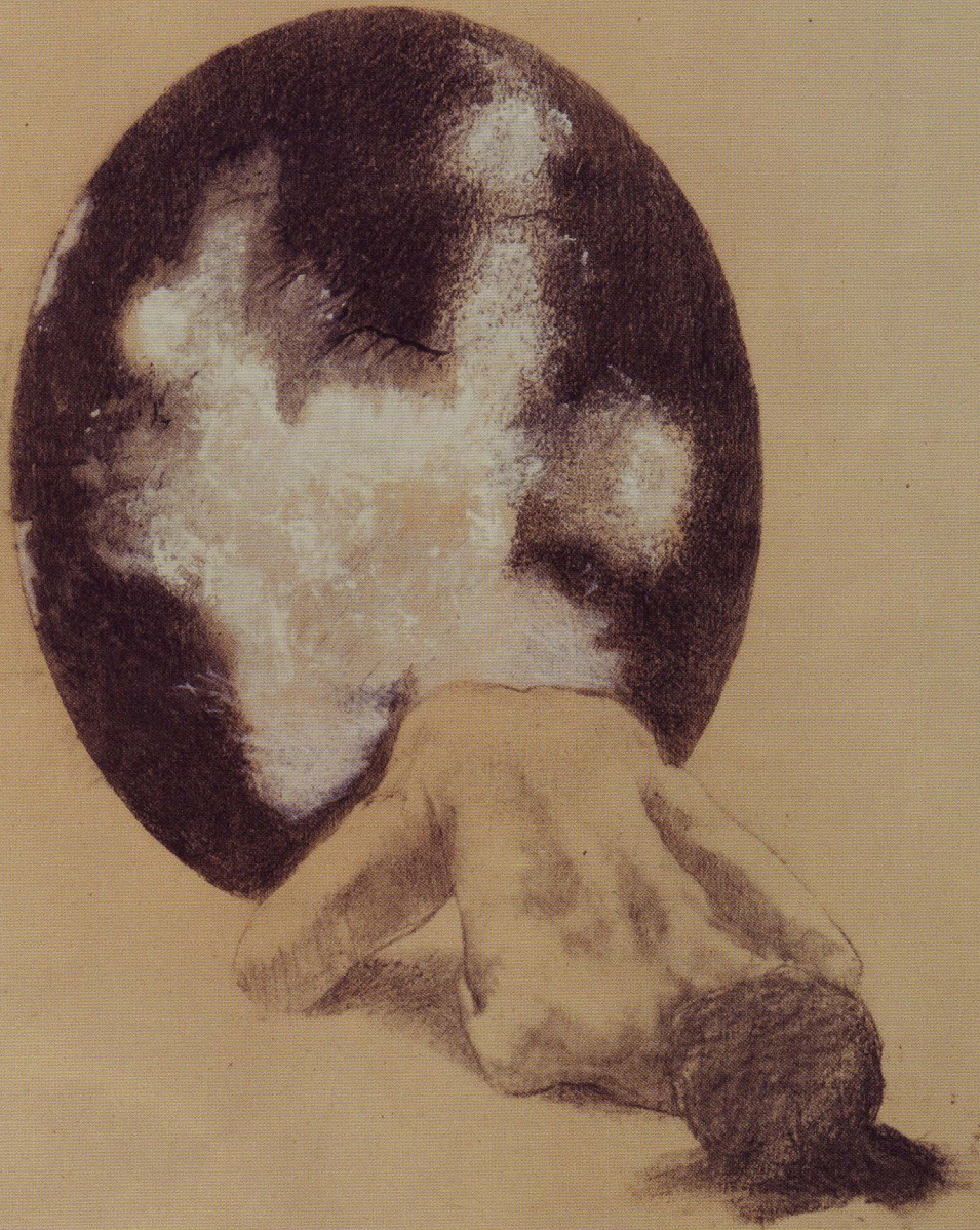
Le Père de l'abstraction , 2010

Transfert sur papier ancien rehaussé de crayons et pastels secs, 56 x 45 cm.