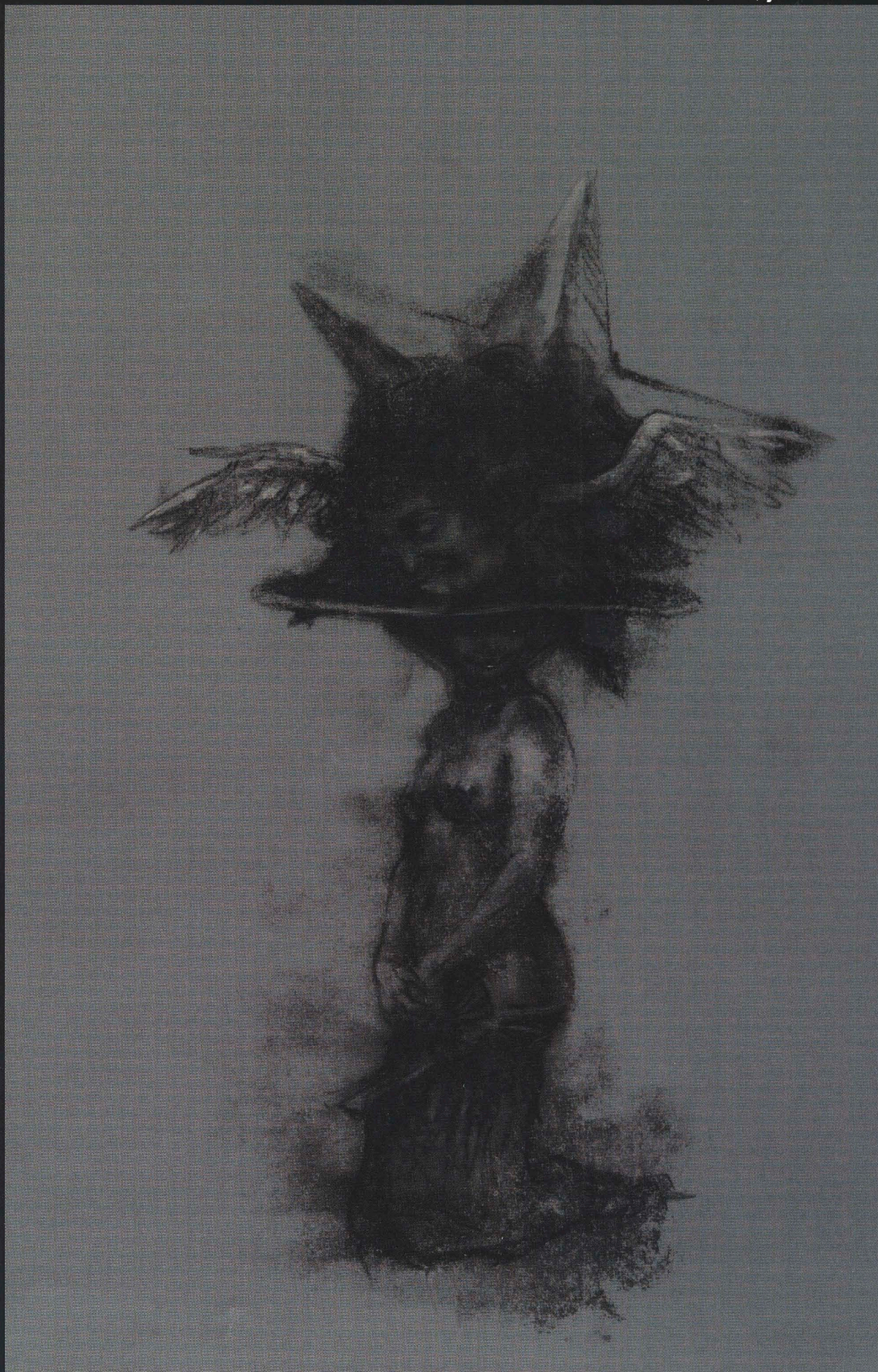
Belle , 2010

Transfert sur papier rehaussé de crayons de couleur, 54,2 x 32 cm.