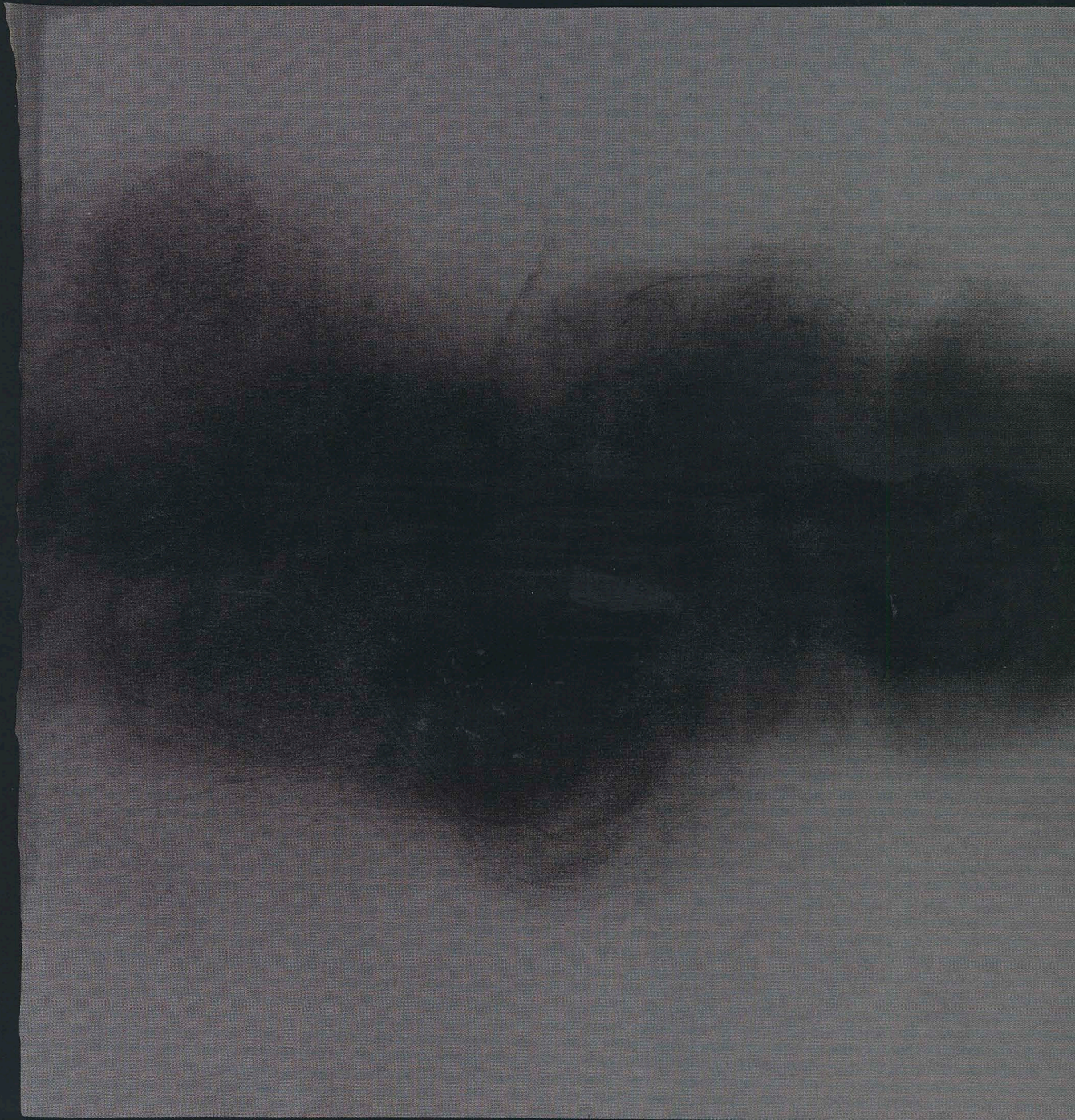
Propagation forcée de la foi, 2010

Transfert sur papier, rehaussé de crayons de couleur, 29,2 x 58,6 cm.